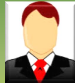
Interlocutore non indagato